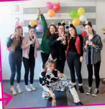
... pustne maskare