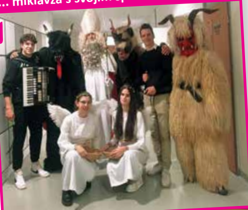
... miklavža s svojim spremstvom