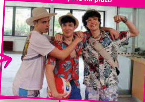
... dijake, pripravljene na plažo