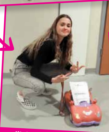
... dijake brez nahrbtnikov